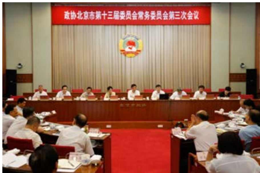
▲政协北京市第十三届委员会常务委员会第三次会议

科学技术一体化、学科交叉融合、高新技术产业集群化、科学技术发展速度指数化等是现代创新的特征，导致科技创新活动不断突破地域、组织、学科、技术、产业的边界，创新的竞争本质上已演化为创新体系的竞争，要求构建若干包括基础研究、应用开发、产业发展、示范应用等四层次的“顶尖、腰强、底实”的“正金字塔”、科学技术产业一体化的创新组织系统。金字塔顶端是少而精的前沿研究机构，中间是工程技术能力突出、多学科融合的应用开发群体，下层是技术消化能力突出的企业及用户网络，上层积累的是“势能”，下层则将“势