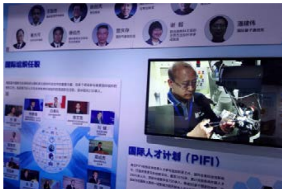
▲ 构建多元化国际人才结构