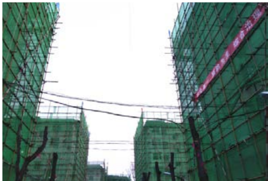
▲改造中的通州区中仓小区

长期以来，我国社会运行和发展的基础是年轻型社会，环境建设大多基于年轻人的需要，对老年人的特殊需求考虑不够。在老龄化社会背景下，因住房适老化程度低，给老年人带来的生活不便甚至安全风险成为日益严重的社会问题。在“以居家养老为主，社区服务为依托，机构养老为补充”的国家养老政策框架下，不论是在政策价值、社会价值还是产业价值上，开展多层老旧住宅建筑的“适老”化改造有着重要的意义。