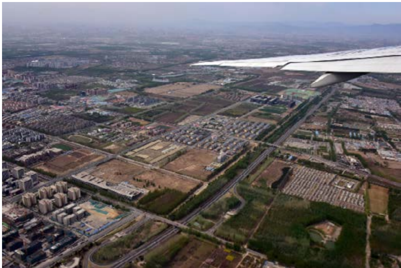
▲ 鸟瞰北京城乡接合部

转移实际上可以有异地转移和就地就近转移两种方式。作为超大城市郊区的乡村，本来就有条件保持乡村的生机与活力，因为绝大多数聚落都在距离中心不足百公里范围之内，多年来道路建设、快速交通、公共交通等提供的便利，机动车进入家庭，各类新兴产业的兴起，都使外围地区可能有居有业，适合就地就近地为转移农业劳动者提供就业和收入的机会。那么，为什么在前一阶段大量出现的是异地转移？原因很多，不可否认的是也存在着就地就近转移的政策性偏向和制度性障碍。所谓“政策性偏向”，比如简单地理解“聚集原理”并忽视转