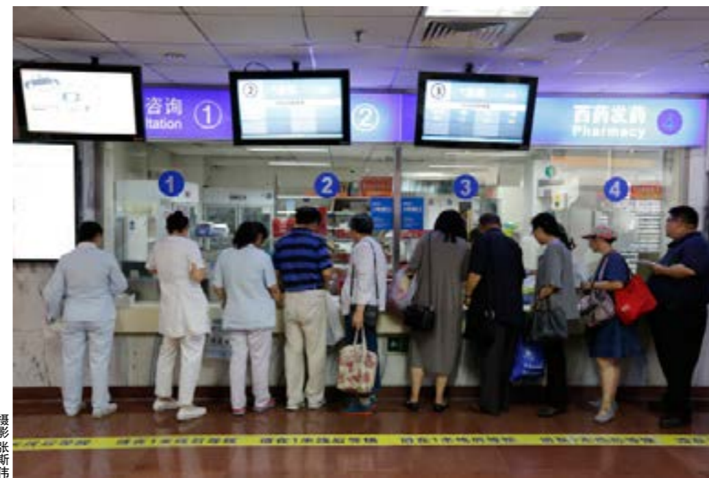
▲ 引导患者到基层就医

医院、基层医院是合理的,但对于三级甲等医院,这样的评价体系有待商榷,会无形中制约医院的发展方向。努力缩短平均住院日,医疗的“量”提高了,“质”却难以保障。因此应提倡各级医疗机构的绩效考核区别对待。