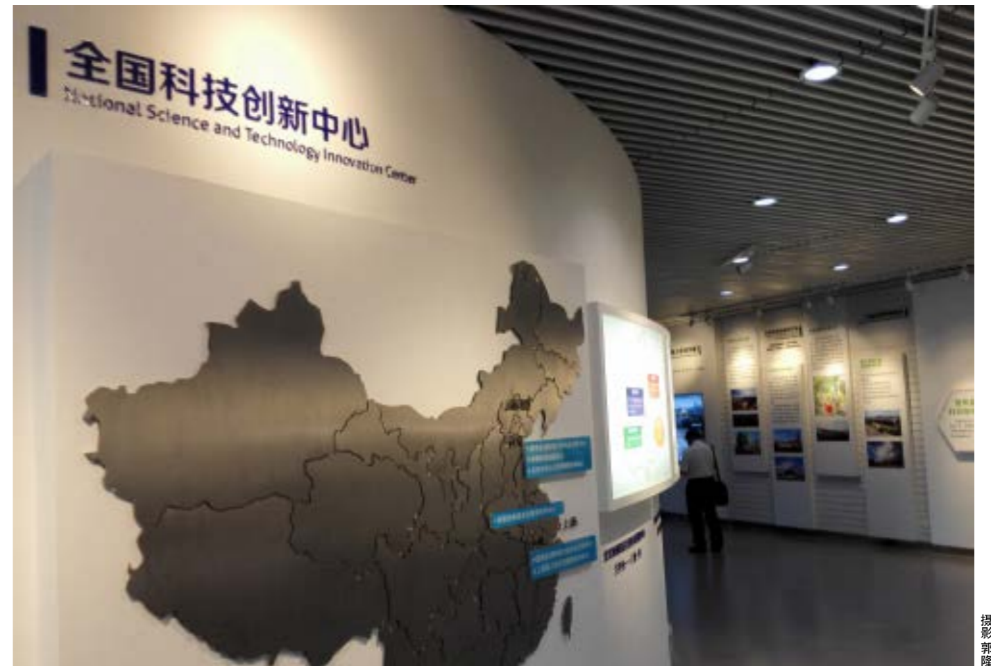
▲ 注重原始创新、扶持大企业创新是当务之急

京东方就是一个很好的范例。它曾经是中国最大最强的电子元器件厂，随着半导体技术的出现，京东方连续亏损，一度濒临破产。后来，在