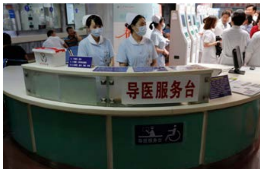
▲ 各级医疗机构的评价体系应差异化调整

的常规手术是其他医院、二级医院和基层医院都可以完成的,但许多患者仍然选择在协和进行治疗,“排队”等待手术数周甚至数月,这一现象需要我们反思。一方面,分级诊疗制度应建立在充分的“多点执业”基础上,让人民群众基层首诊的意愿增强。另一方面,要体现“三甲医院”的“功能性”。目前评价医院临床质量的指标包括“手术量”“平均住院日”“空床率”等,这些指标的制定对于二级