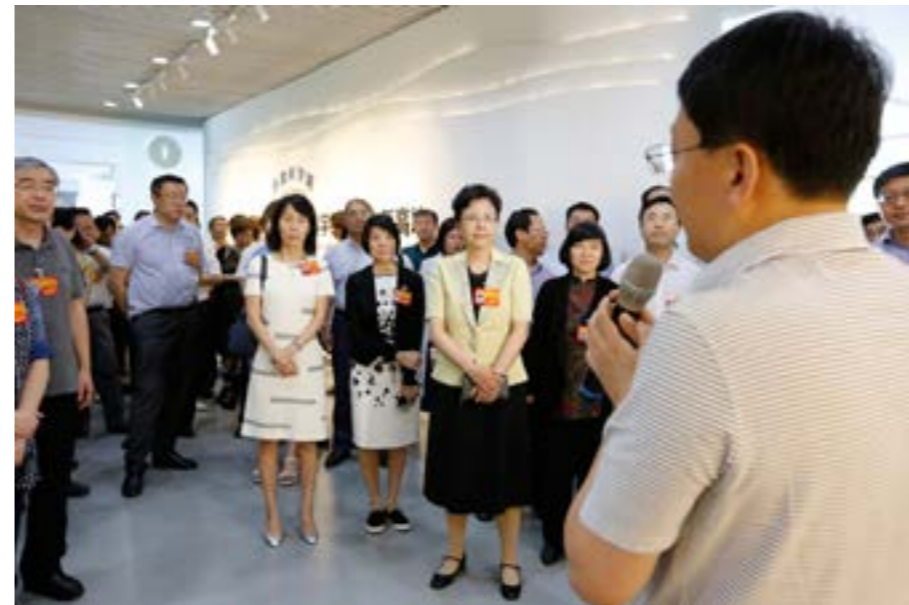
▲ 北京市政协组织常委视察怀柔科学城