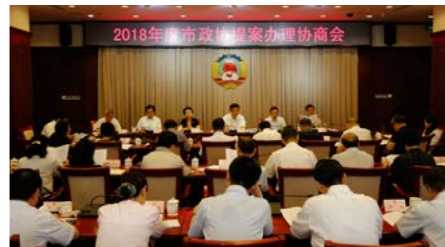
▲ 2018年度北京市政协提案办理协商会

市政协主席吉林指出，提案办理协商是政协协商民主的重要形式，在这个协商平台上，相关政府部门和委员围绕全市重点工作和人民群众普遍关心的问题，把相关提案集中起来办理并进行充分协商，凝聚各界共识，推动问题解决。近几年，市政协围绕医改问题开展了“连续剧”式的调研，每年都选取不同主题进行深入调研。希望相关部门和政协委员深入学习习近平总书记在全国卫生与健康大会上的重要讲话精神，继续多角度关注深化医疗体制改革，在完善分级诊疗、改革医护人员薪酬机制、建设紧密型医联体、完善医保政策等关键性问题上进一步加强研究，力争在认真调研的基础上提出更多良策实招，为北京卫生与健康事业发展贡献智慧力量。