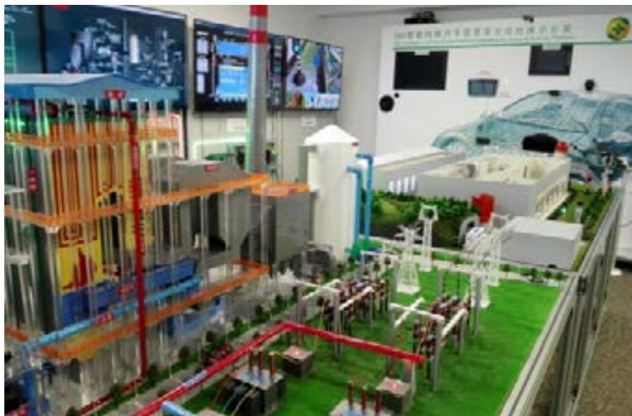
▲ 高新技术产业集群化